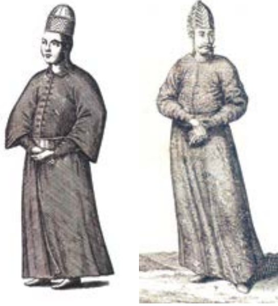
Sarayda, Has Odada Görev Yapan Galata Sarayı Mektebi Mezunları

Osmanlı İmparatorluğu'nun en muhteşem devrinde, Kırım'dan Viyana'ya, Tunus'tan Fas'a kadar hüküm sürüp, Akdeniz'i kendi havuzu gibi kullandığı zamanlarda, Saray Mektepleri, İmparatorluğun bütün sivil memurlarını, küçük / büyük bürokratlarını, sipahi erlerinden kumandanlara kadar yöneticilerini, Yeniçeri Ağasını, Sadrazamını, Defterdarını, Kubbe Vezirini, divan şairlerini, tarihçilerini, hattatlarını, Beylerbeylerini ve Valilerini yetiştirmiştir.