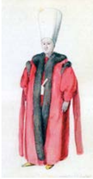
Galata Sarayı Mektebi Ağalari

Saray Mekteplerinden yetişenlerin üstünlüğünün bir başka sebebi de, beden eğitimine özel bir önem verilmesi idi. Osmanlı ordusunun bir kısım erleri, sipahileri ve bazı subayları da Saray Mekteplerinden yetiştiği için, o devirlerdeki askerlik mesleğinin gerektirdiği bedensel çeviklik, vücut zindeliği, at binme, ok atma, top ve çup, tomak ve cirit oynama gibi sportif etkinliklerle beden eğitimi, Saray Mekteplerinde programlı ve örgütlü olarak çok gelişmişti.