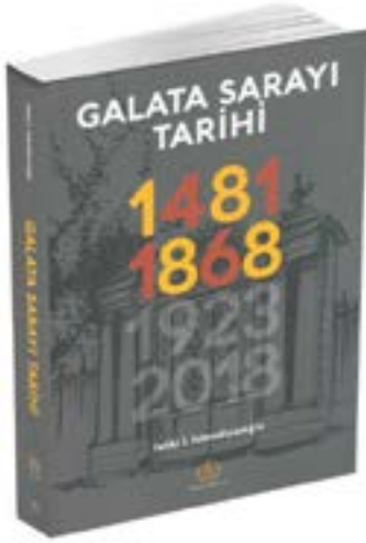
2018 yılı Baskısı

bilgiler, sözü edilen kitapların içinde parça parça, kısım kısım, farklı konu ve başlıklar altında, dağınık bilgiler halindedir. Böyle olması da doğaldır. Zira, Fethi İsfendiyaroğlu'nun "Galatasaray Tarihi" gibi doğrudan Galata Sarayı'na özel olarak kaleme alınmamışlardır.