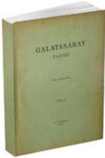
1954 yılı Baskısı

... Bir mektep yaşlandıkça, mazisi uzadıkça gelişir ve sosyal hayattaki etkisi ve rolü de o oranda artar. Bu bakımdan, mekteplerimizin tarihini yazmak, onların sadece duvarlarını ele alıp, inşa tarihlerini, geçirdikleri yangınları, taşınmalarını veya yeniden yapılmalarını, ek binalarını ve kuru kuruya ders programlarını sayıp dökmek değildir. ... Fiziksel coğrafya tarih için ne kadar gerekliyse, bunlar da kurumsal tarih için o kadar gereklidir, fakat yeterli değildir. Çünkü, okulların asıl tarihi manevi varlıklarındadır. Değerlerinin asıl ölçüsü de onlarda yatar. Bu yüzden bir mektebin tarihi, sosyal hayatın, hatta dünkü, bugünkü ve yarınki nesillerin ve ülkenin gelişimine dair çeşitli konuların incelendiği çok katmanlı bir alandır.