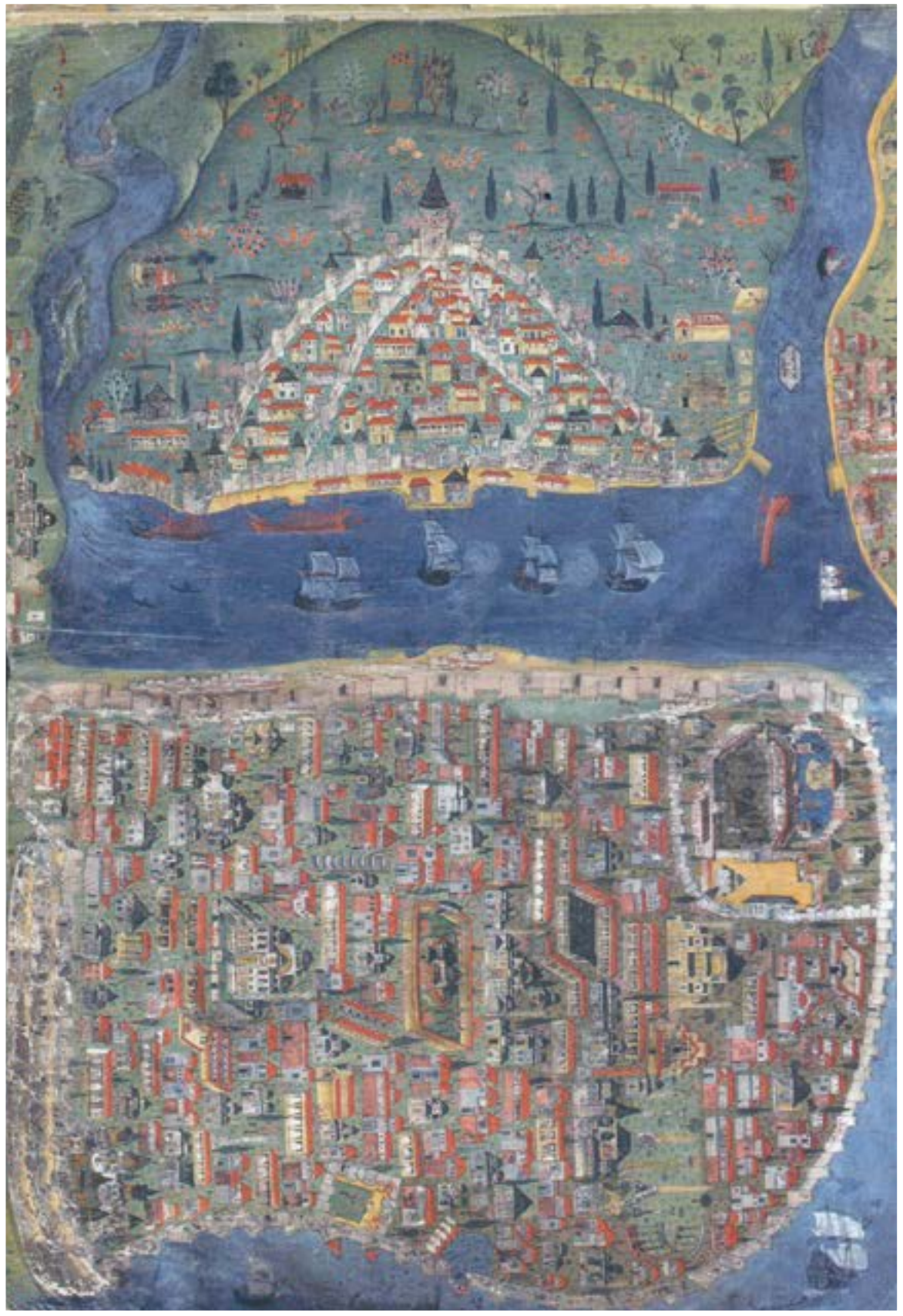
Matrakçı Nasuh'un 1533 yılında İstanbulu resmettiği Galata Sarayı olduğu tahmin edilen sağ üstteki bina