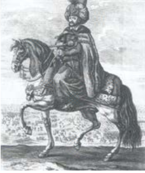
Sadrazam Köprülüzade Fazıl Ahmet Paşa

camii Sultan Ahmet” olarak tarihe geçen bu olay “Yeniçerilerin hüsn-ü hizmeti ile, zorbalara şiddetle te’dir edilmesi” suretiyle sona erdi. Çok kan döküldü.